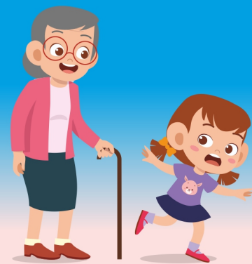
ПРАВИЛО ТРЕХ ШАГОВ